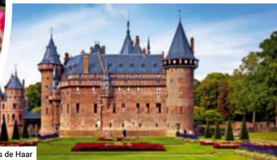
Schloss de Haar